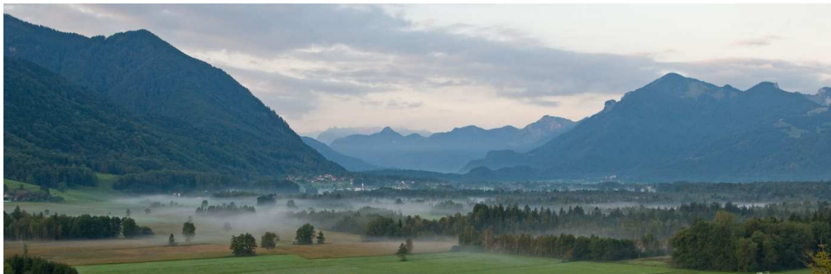
Abb. 1: Blick ins Achental vom Osterbuchberg.

Viele Landschaftsbestandteile im Achental sind ganz oder teilweise geschützt. Großen Anteil daran haben die Naturschutzgebiete – insgesamt neun innerhalb der Gebietskulisse. Dazu kommen einige kleinere und ein großes Landschaftsschutzgebiet (Chiemsee), Wiesenbrütergebiete und – flächenmäßig unbedeutend – etwa ein halbes Dutzend Naturdenkmäler und geschützte Landschaftsbestandteile. Abbildung 2 und Tabelle 1 geben einen knappen Überblick über Schutzgebiete und Gebietskulisse.